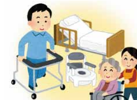
福祉用具レンタル