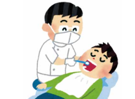
訪問歯科・口腔ケア